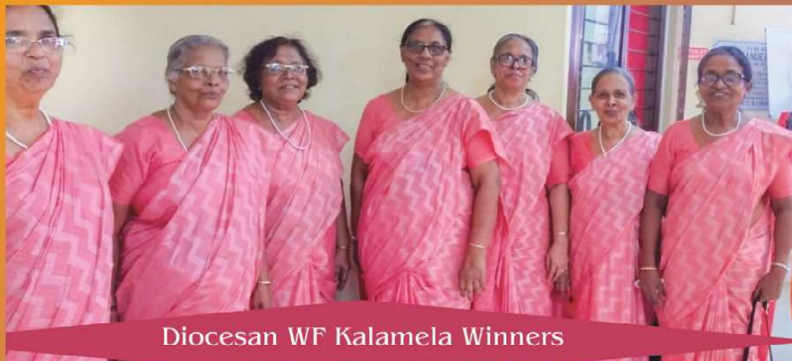
Diocesan WF Kalamela Winners