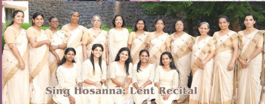
Sing Hosanna: Lent Recital